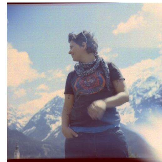
Selbstportrait mit Lubitel Box (1956)

Fokus: Künstlerischer Schaffensprozess | Arbeits- und Produktionsphase 2025 – 2027 Ausarbeitung von Präsentations-, Print- und Ausstellungsformaten